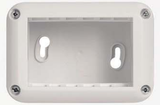
3 módulos blanco 719184