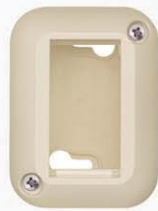
1 módulo marfil 713893