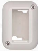
1 módulo blanco 713892

Disponibile en tres formatos, 1, 2 y 3 módulos. Colores blanco y marfil.