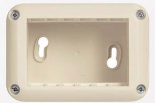
3 módulos marfil 719185