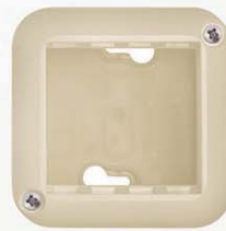
2 módulos marfil 713895