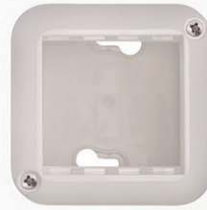
2 módulos blanco 713894